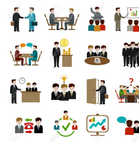
oprichten van een klankbordgroep bij De Haardstee