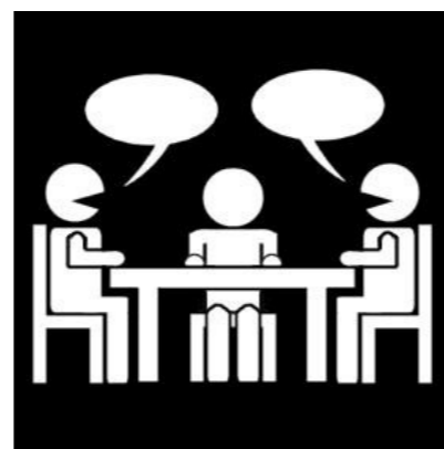
installatie nieuwe cliëntenraad