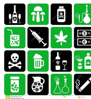
Alcohol- en drugsgebruik (risico's en regels)