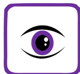
Raad van Toezicht